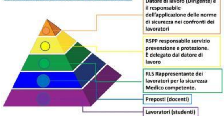
PIRAMIDE DELLE RESPONSABILITÀ SULLA SICUREZZA